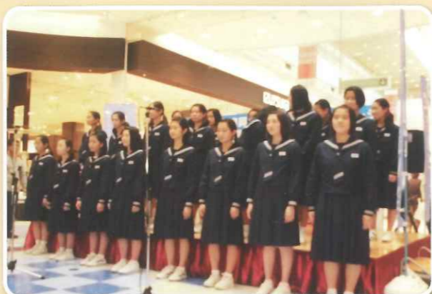
北九州市立二島中学校 合唱部のみなさん