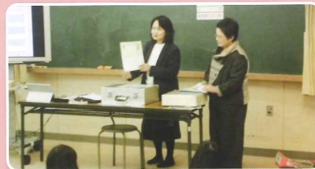
絵はがきコンクール説明