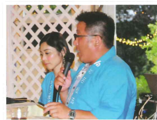
青年部で司会も担当しました!