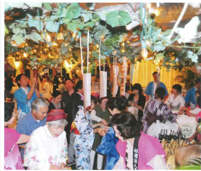
チャリティー販売も大盛況