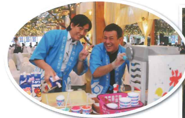
ウエルカム「かき氷」大繁盛