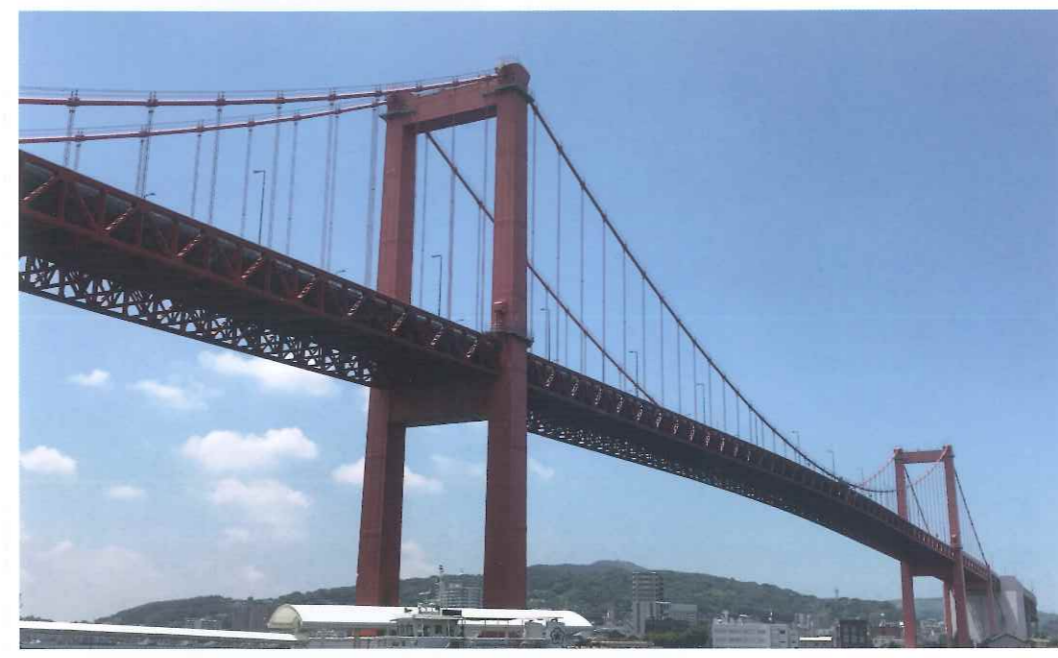
現在を戸畑側から(平成30年8月)