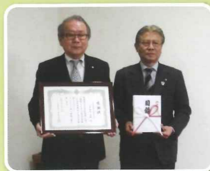
平成30年1月22日芦屋町図書寄贈

平成29年11月23日(木)中間・芦屋・水巻・岡垣・遠賀支部でバス研修会を実施しました。