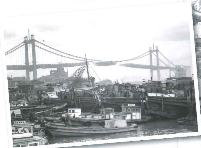
架橋工事風景(昭和37年2月)