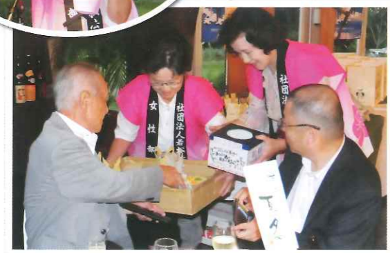
チャリティー募金のご協力ありがとうございます。