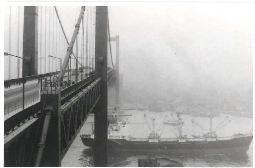
当初は歩道上を歩いて渡ることが出来ました。(昭和37年9月)