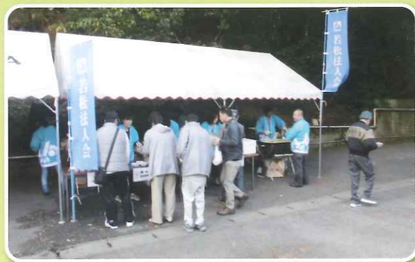
若松4支部ひびき学園祭出店

平成29年11月12日(日)障がい者福祉支援事業として社会福祉法人ひびき学園の「学園祭」支援のため、焼きそば等の店を出店し、参加者に軽食の提供をしています。