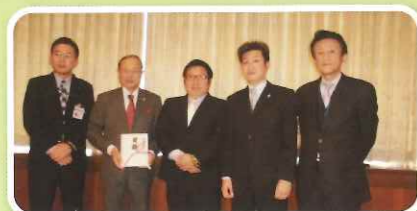
平成29年12月27日岡垣町図書寄贈

平成29年度の図書寄贈を下記の管内3自治体に行いました。各首長から市民及び児童向け図書を充実させることができると大変喜んでいただきました。