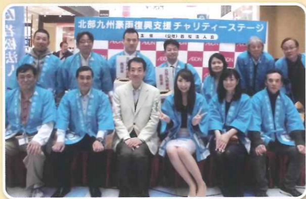
チャリティーステージスタッフ