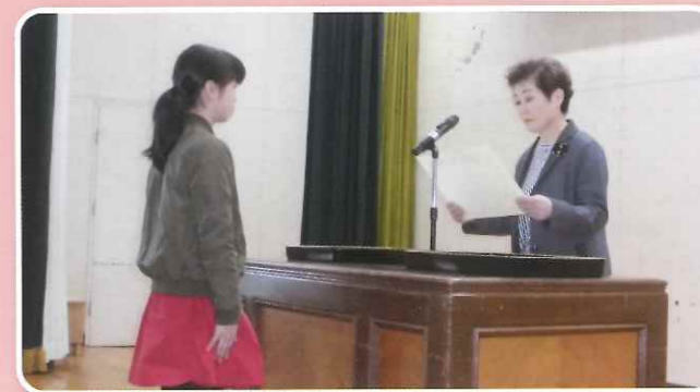
絵はがきコンクール表彰