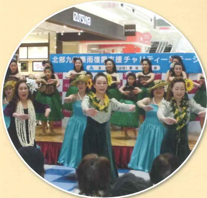
フラダンスチームのみなさん

平成30年3月18日東日本大震災の復興支援のためイオン若松ショッピングセンターにおいてチャリティーコンサートを行い、会員や一般市民の方約130名が来場し、コンサートを楽しみました。