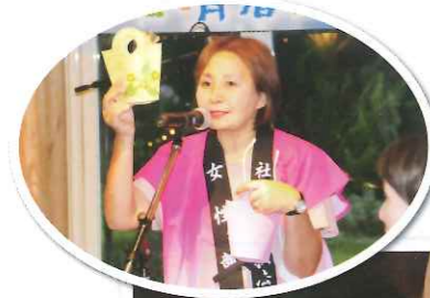
女性部会による チャリティー募金