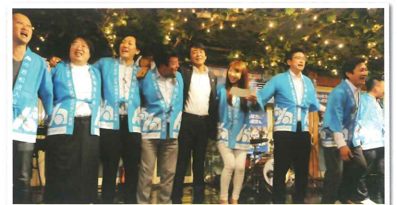
最後に「上を向いて歩こう」を大合唱