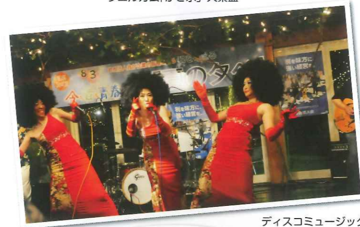
ディスコミュージックバンド「d・w・p」