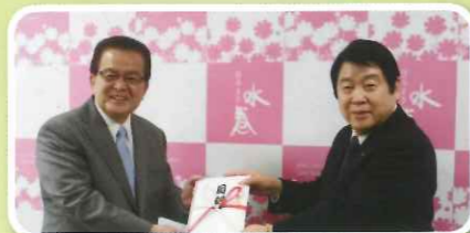
平成30年1月5日水巻町図書寄贈