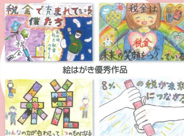
絵はがき優秀作品

青年部会が租税教室を実施した小学校6年生を対象に、女性部会が「税に関する絵はがきコンクール」を行い、300通の応募がありました。また、優秀作品には表彰状と記念品を渡し、税に対する関心を高めました。