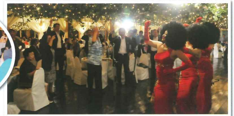
盛り上がり最高潮