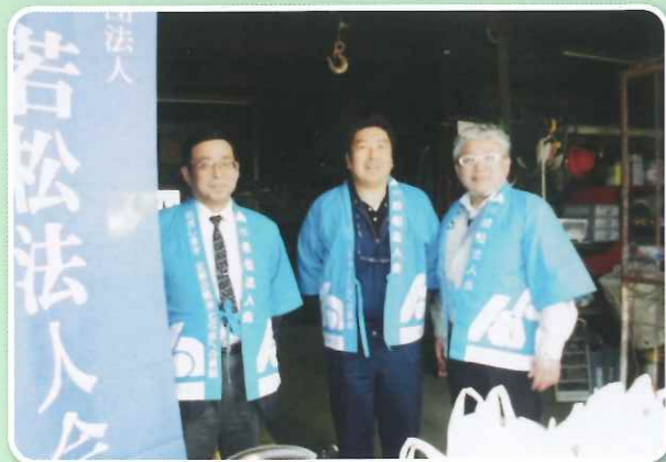
若松3支部献血活動

平成30年4月4日(水)二島工業団地において献血支援活動の取り組みを行い、同団地の会社を中心として各社の従業員の方の協力を得ることができました。