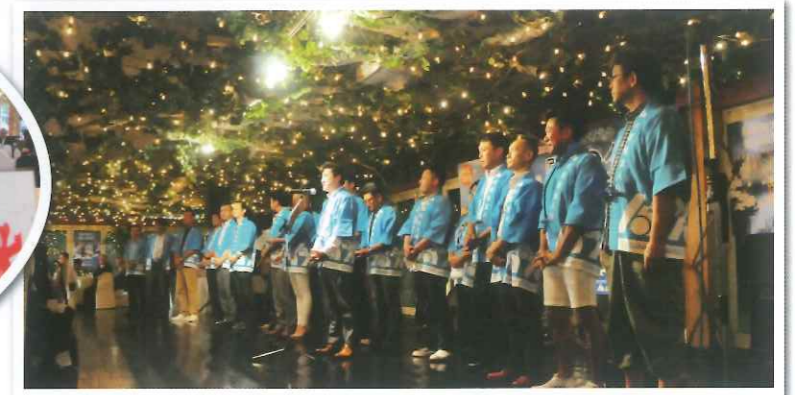
川地青年部会部会長挨拶