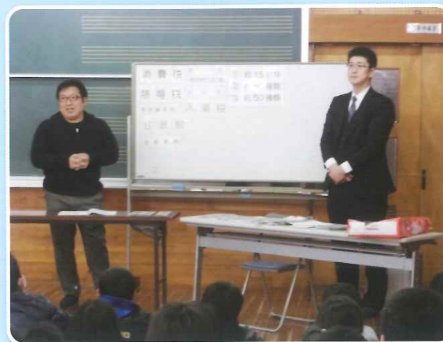
青年部会租税教室風景

青年部会は租税教育活動の一環として、小学校6年生を対象に租税教室を実施しております。青年部会のメンバーが講師となり、税金の重要性をわかりやすく説明しております。