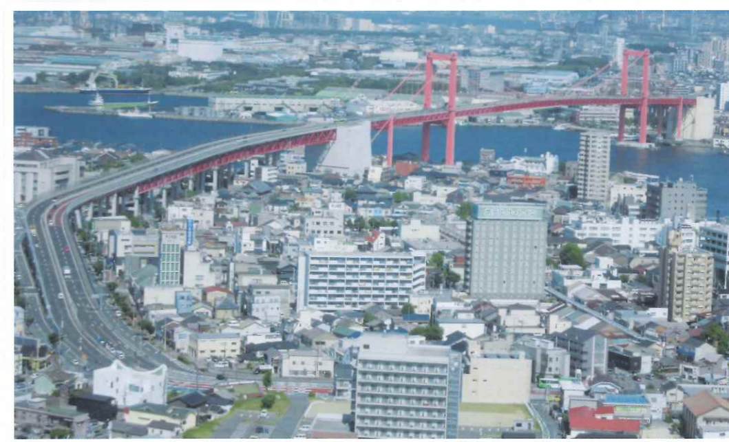
現在を高塔山から(平成30年8月)