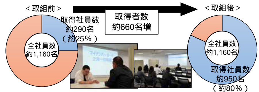
C社のマイナンバーカード取得状況