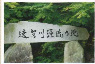
流域面積1026㎡に達する遠賀川は この小さな源流から始まります