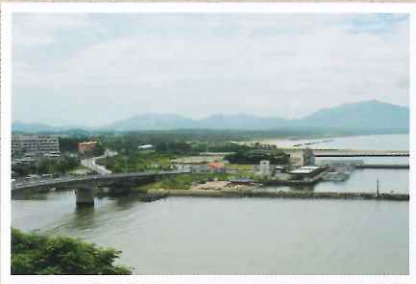
魚見公園からの遠賀川河口 遠くに見えるのは岡垣新松原海岸

北九州市、中間市、直方市、飯塚市、田川市、山田市の6市に加え、遠賀郡、鞍手郡、嘉穂郡、田川郡の4郡で構成された筑豊炭田。一時は国内需要の半分を担った日本最大の炭鉱地帯がこれほど栄えた理由には、遠賀川を利用し産炭地である筑豊から、積出港の芦屋・若松や八幡製鉄所への大量の石炭輸送が円滑に行なわれたことにあります。また、サケが溯上する南限の川として知られ、一時は石炭洗浄で水質が悪化し溯上は途絶えましたが炭鉱閉山の後、昭和53年には再び下流域でサケが確認されました。遠賀川という名称は明治後期から江戸時代は御牧川と呼ばれていました。これは大昔、馬の牧場が多かったことに由来しているそうです。