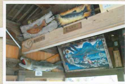
嘉麻市大隈の鮭神社 祭礼で鮭を祀るのは国内唯一