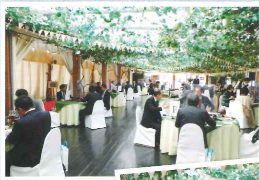
長年の 法人会での活動に 話が弾みます