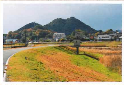
飯塚市忠隈のボタ山は高さ121m 現存するピラミッド型では国内最大